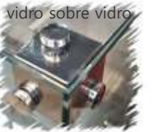
vidro sobre vidro