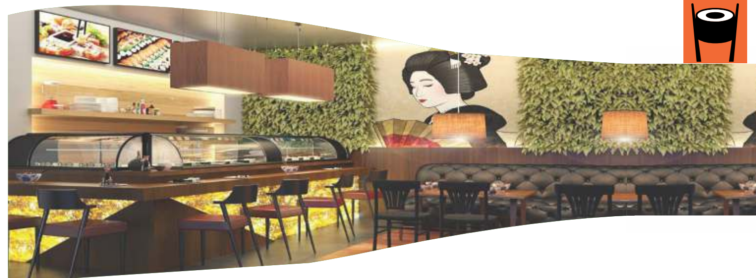
Vidro plano - cód. BCVFS 90